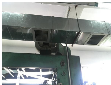
廢氣收集現場照片