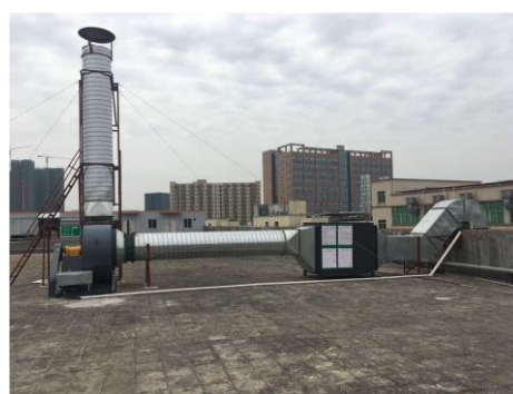
紫外線光催化系統的外觀

膠袋印刷過程中會使用油墨在印刷機上進行塑膠原膜的印刷，油墨和有機溶劑的使用會產生一定量的有機廢氣，對員工健康、生態環境造成影響。振業原通過通風系統無組織排放有機廢氣至室外環境中。工廠為有效收集和處理有機廢氣，減少廢氣對環境造成的影響，急需尋求先進的技術和設備處理有機廢氣排放。